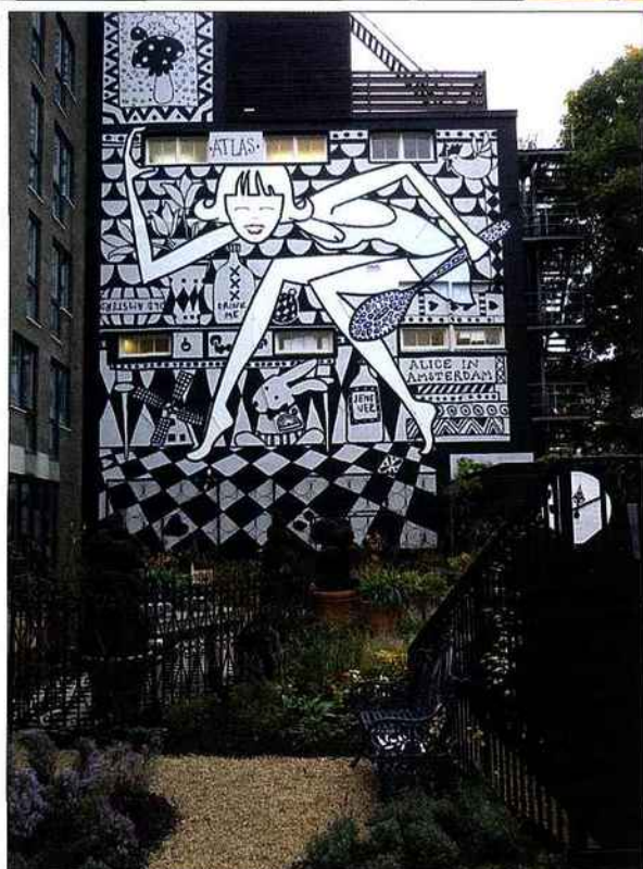
Fresque réalisée par Marcel Wanders.

Fidèle à la philosophie de la jeune marque Andaz, les espaces publics qui s'enroulent autour de l'atrium central se découvrent d'un seul tenant, sans partition évidente. Et pourtant, chaque unité – qu'elle soit lobby, lounge, restaurant, cuisine ouverte, bar ou atrium – diffère en volume, couleur et atmosphère, variant du plus sombre au plus lumineux, du plus minimal au baroque, du plus atonale au plus coloré.